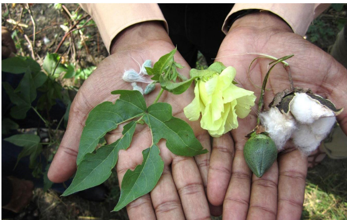
Från frö till bomull färdig att plockas.