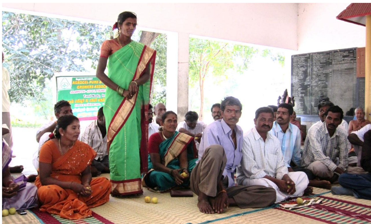
Några av bönderna som är med i bonderådet Producers executive body.

När det gäller bomull har Agrocel olika Fairtrade-projekt i Gujarat, Orissa, Tamil Nadu, Andhra Pradesh och Karnataka. Projekten har vuxit snabbt, från 125 bönder år 2003 till nära 8000 bönder 2010 (från 850 acres till 80 000 under samma period). Agrocel stod våren 2011 bakom sju grupper av Fairtrade-odlare i olika indiska delstater. Av dessa är Agrocel Pure & Fair Cotton Growers Association den grupp som gjort bäst ifrån sig. Orsaken är böndernas relativt höga utbildningsnivå vilket delvis kan förklaras med att Tamil Nadu är en relativt välskött delstat med politisk stabilitet.