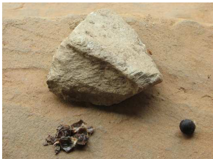
Bild 6: Lokalt krossas nöten med en sten och flisorna används för att utvinna tvättmedel.

I Sverige använder vi tvättenöten i våra tvättmaskiner, men på plats i Nepal används den vid handtvätt. För att få den lödbrande effekten och för att kunna komma åt det verkande ämnet saponin i nöten så krossas den. Mest vanligt är att man tar en sten och slår hårt mot nöten till den är i flertalet små flisor. Fröet inuti kastas bort. Klädesplagget man önskar tvätta viks ihop och inuti det vikta plagget placerar man flisorna för att sedan gnugga hårt i vatten så att bubblor utvecklas och såpan träder fram. Sedan sker tvättningen enligt de allmänna handtvättsprinciperna. Det krävs cirka 15 nötter till en större tvätt och 6–7 stycken till en mindre.