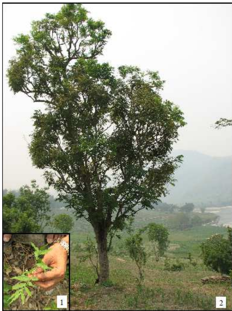
Bild 3: Under besöket i april 2009. Lilla Bild 1: Ny liten planta, Bild 2: Fullväxt träd

Trädets karaktär förändras under året. I maj får det vackra blommor och under juni och juli månad börjar nötterna, av lokalbefolkningen kallad frukt, att växa. De är färdiga för skörd i slutet av oktober. De plockas sedan från slutet av oktober till början av januari. I januari faller de av naturligt om ingen plockat ned dem. Att nötterna faller naturligt till marken påverkar inte deras kvalitet om de snart efteråt tas om hand. Om de däremot ligger några veckor blir nötens effekt inte lika intensiv. Enligt invånarna i byn Jyamrung så är kvalitén bäst direkt efter att de är plockade, men de håller god kvalitet under 5-6 månader efteråt. Kvalitén bevaras bättre om nötterna förvaras svalt.